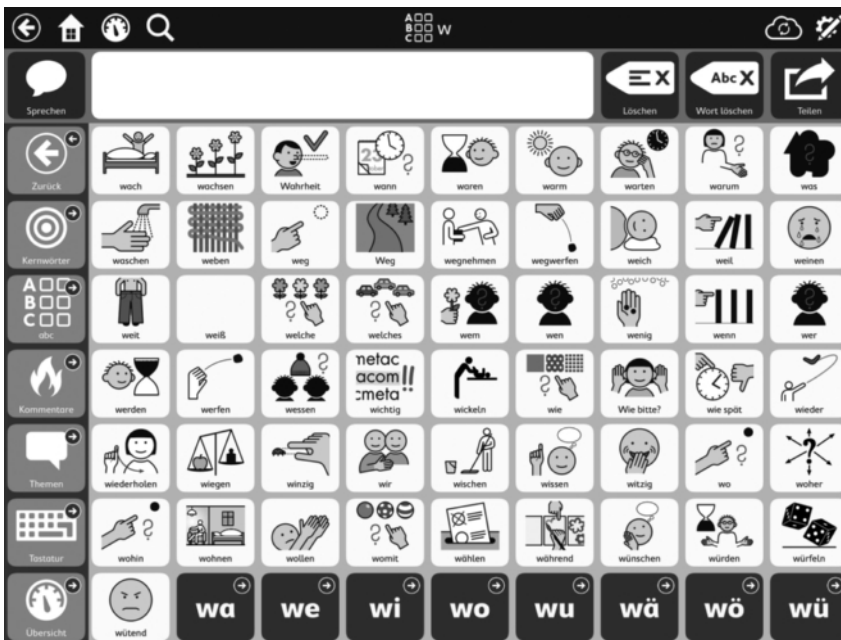
Symbolfelder und weitere Buchstaben nach Auswahl des Buchstabens W

Durch die Auswahl eines Buchstabens öffnet sich eine Seite, auf der direkt wichtigste Worte mit diesem Anfangsbuchstaben sowie mögliche nächste Buchstaben zur Verfügung stehen. Die Symbolfelder sind dabei alphabetisch sortiert.