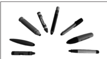
Verschiedene Tabletstifte für Kinder

Es gibt eine Vielzahl unterschiedlicher Tabletstifte, die beim Ansteuern des Displays unterstützen können. Das Angebot umfasst die klassischen Eingabestifte, geht über spezielle Stifte für Kinderhände bis zu speziellen Stiften, die motorische Probleme ausgleichen helfen. Das Angebot an Kinderstiften ändert sich permanent, sodass es problematisch ist, hierzu Empfehlungen auszusprechen. Generell lässt sich aber zu den Eingabestiften sagen, dass es sehr wichtig ist, dass die Oberflächenspannung der Haut auf das Display umgeleitet wird.