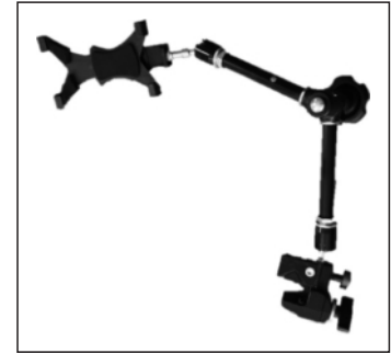
MagicArm von Manfrotto