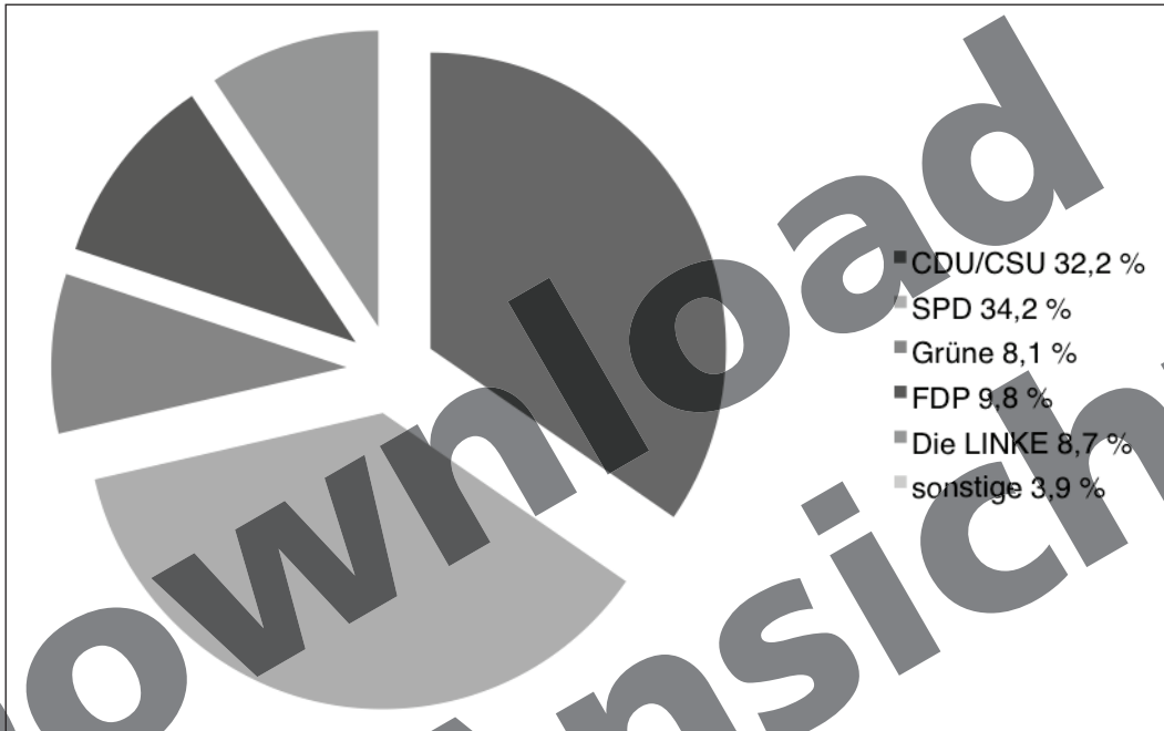
Verteilung der Zweitstimmen (Bundestagswahl 2005), nach Parteien in Prozent